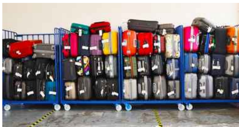
Bagages et produits autorisés