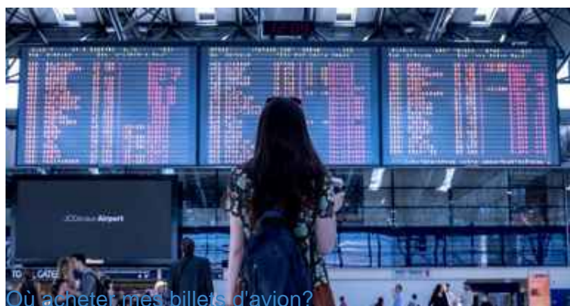
Où acheter mes billets d'avion?