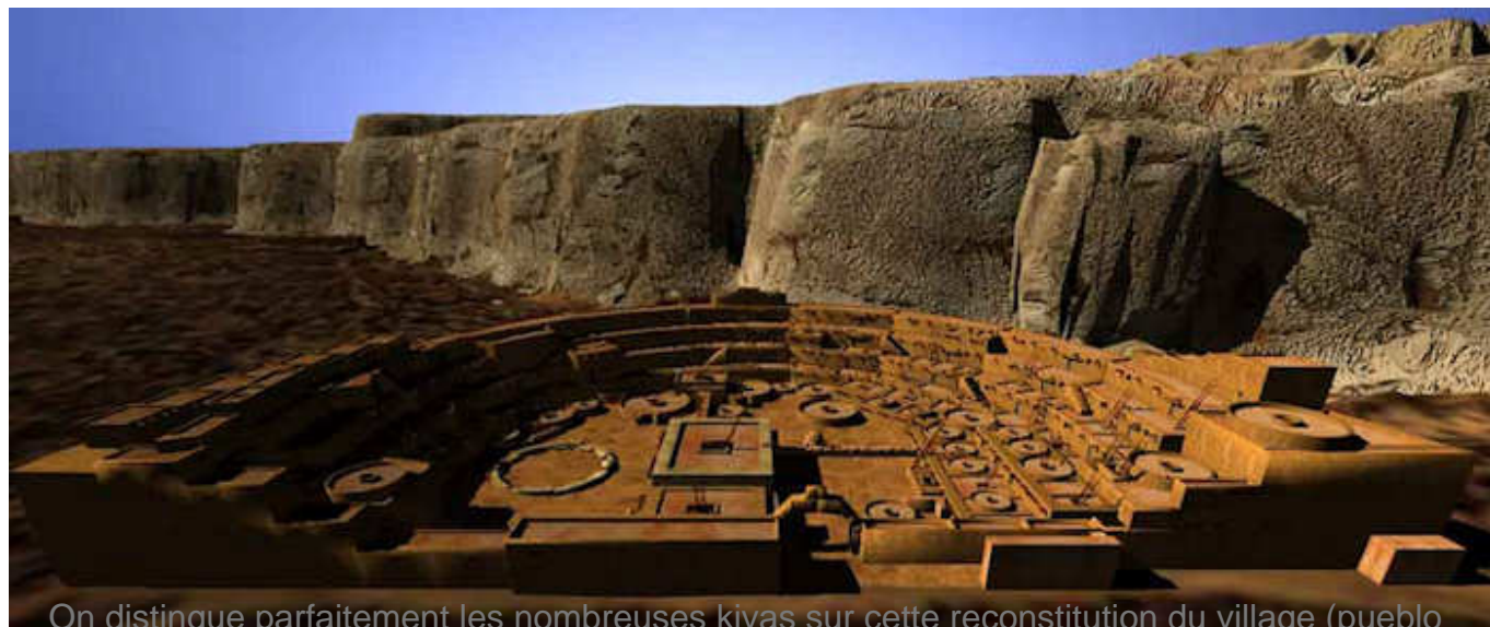
On distingue parfaitement les nombreuses kivas sur cette reconstitution du village (pueblo Bonito) au Chaco Canyon

On trouve dans toutes les ruines Anasazi, ces curieux bâtiments qualifiés de "Kivas", toujours bien différenciés au plan formel : au centre et à l'est du territoire Anasazi, ils sont ronds, établis parfois en surface, d'autre fois enterrés. A l'ouest, ils sont rectangulaire. On en connaît de petits comme à Mesa Verde (quatre à cinq mètres de diamètre), mais aussi de très grands (jusqu'à 20 mètres). Tous les villages en comptaient plusieurs et parfois, comme à Pueblo Bonito (photo ci-dessus) jusqu'à 30.