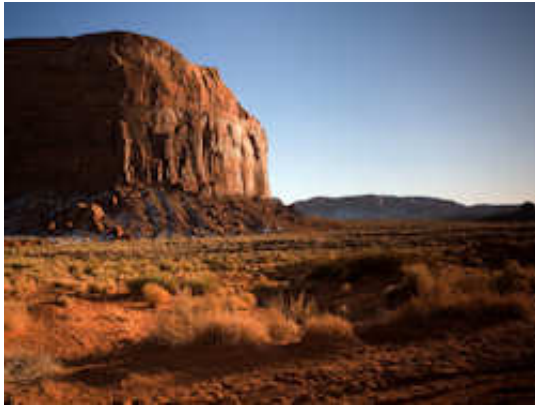
Totem Pole et Yei Bi Chei