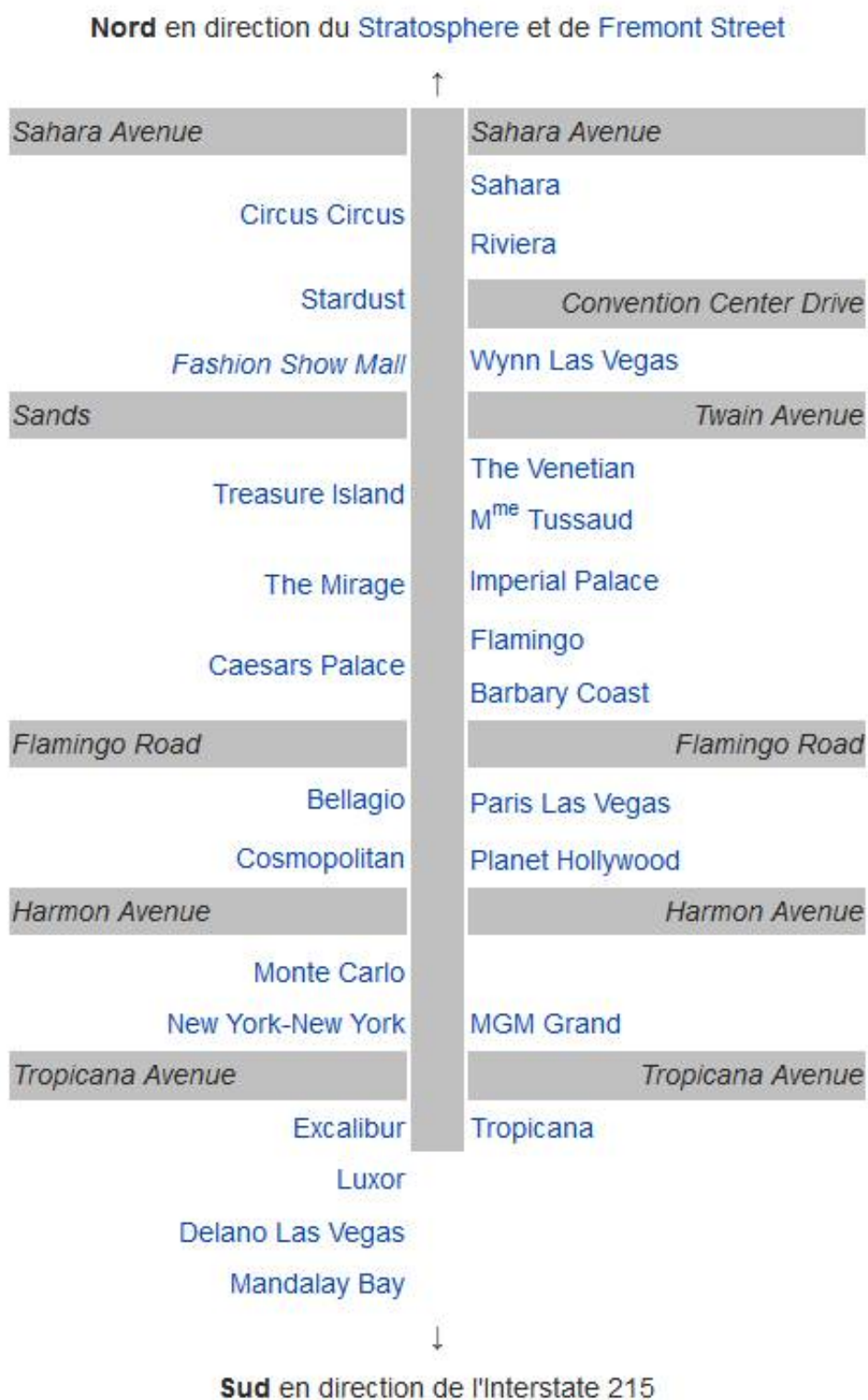
Schema des principaux Hotels/Casinos sur le Strip