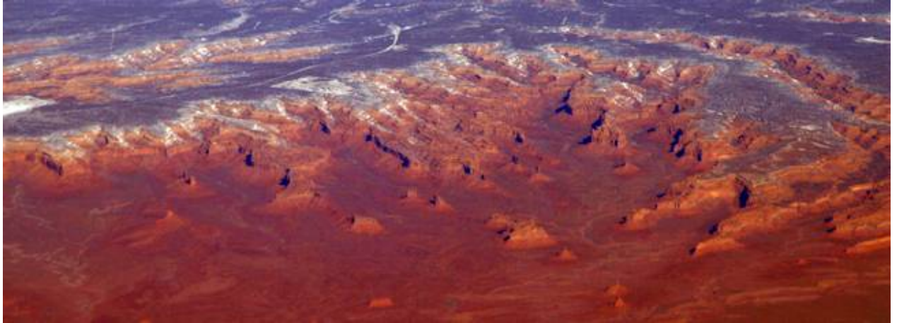
Vue aérienne de Valley of the Gods

Valley of the Gods, la Vallée des Dieux en Français, peut être visitée par une route de terre qui serpente entre les formations rocheuses similaires à Monument Valley en plus petit avec des mesas, des buttes et des falaises de Grès d'un bruns rougeâtres.