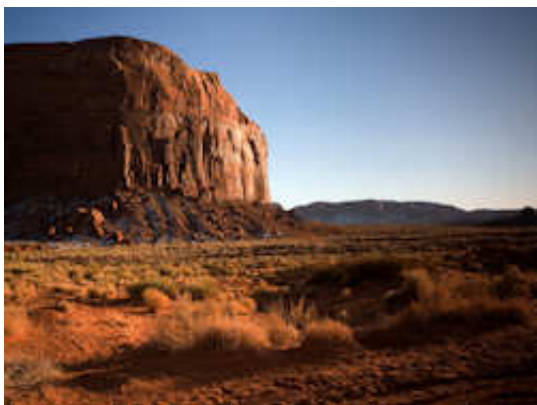
Totem Pole et Yei Bi Chei