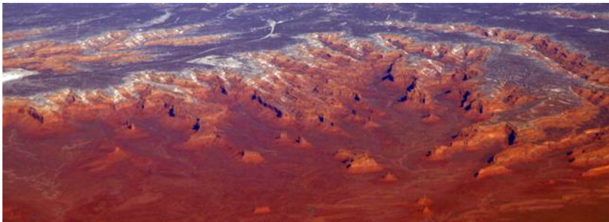
Vue aérienne de Valley of the Gods

Valley of the Gods, la Vallée des Dieux en Français, peut être visitée par une route de terre qui serpente entre les formations rocheuses similaires à Monument Valley en plus petit avec des mesas, des buttes et des falaises de Grès d'un bruns rougeâtres.