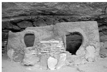
Horsecollar Ruin emprunte son nom à la forme des deux portes vers les greniers.