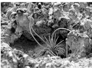
Encroûtement du sol cryptobiotique